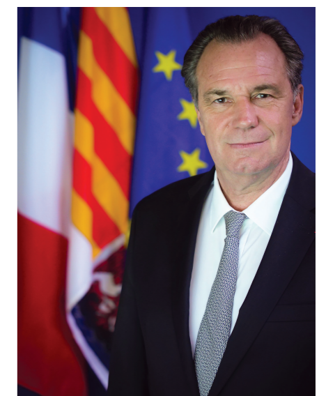
Renaud MUSELIER Président du Conseil Régional Provence-Alpes-Côte d'Azur