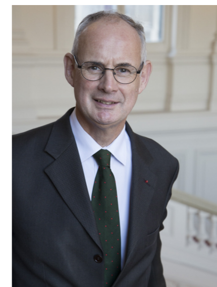
Stéphane BOUILLON Préfet de la région Provence-Alpes-Côte d'Azur